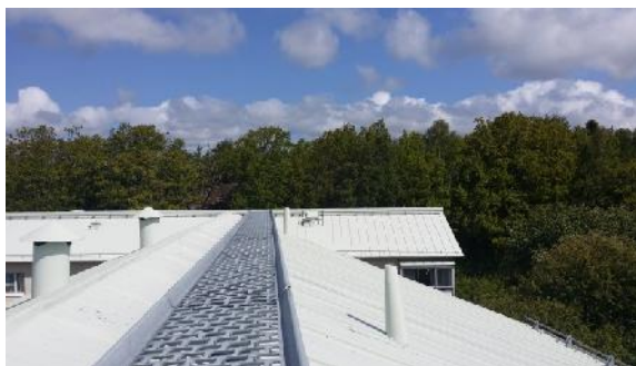
Utsikt från mätpunkten A mot industrin