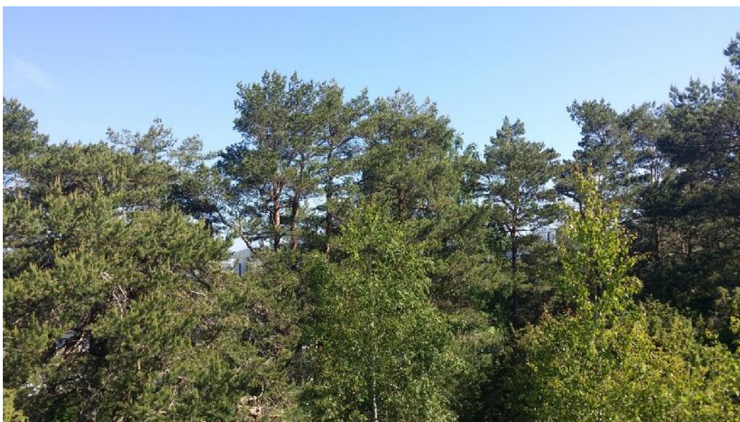
Utsikt från Mp B. Borealis PE samt Vattenfalls skorstenar, vindkraftverken kan skönjas mellan trädtopparna.