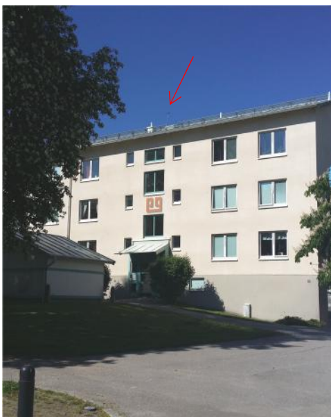
Mp A. Mikrofonplacering