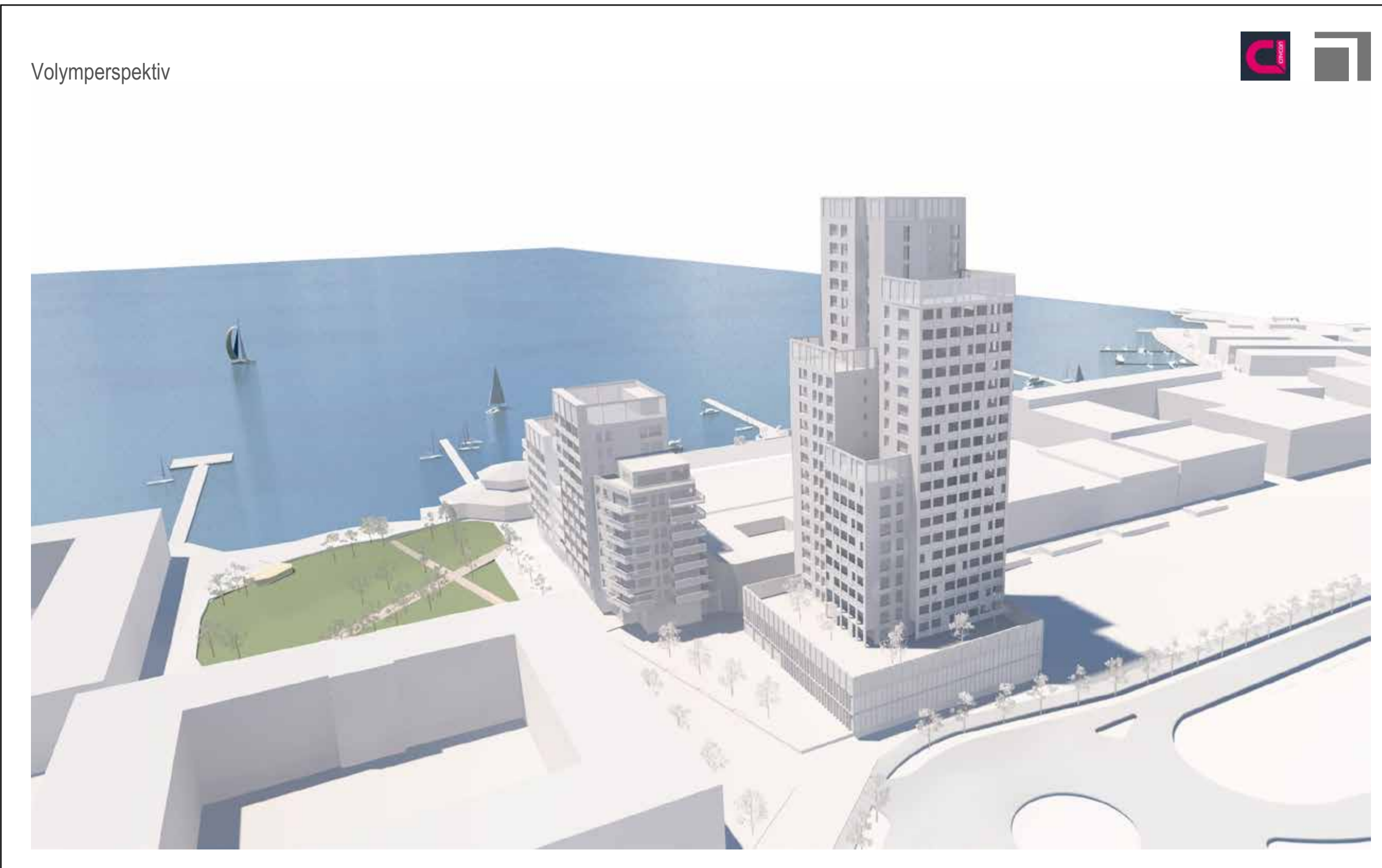
Perspektivbild, planförslaget sett från öst