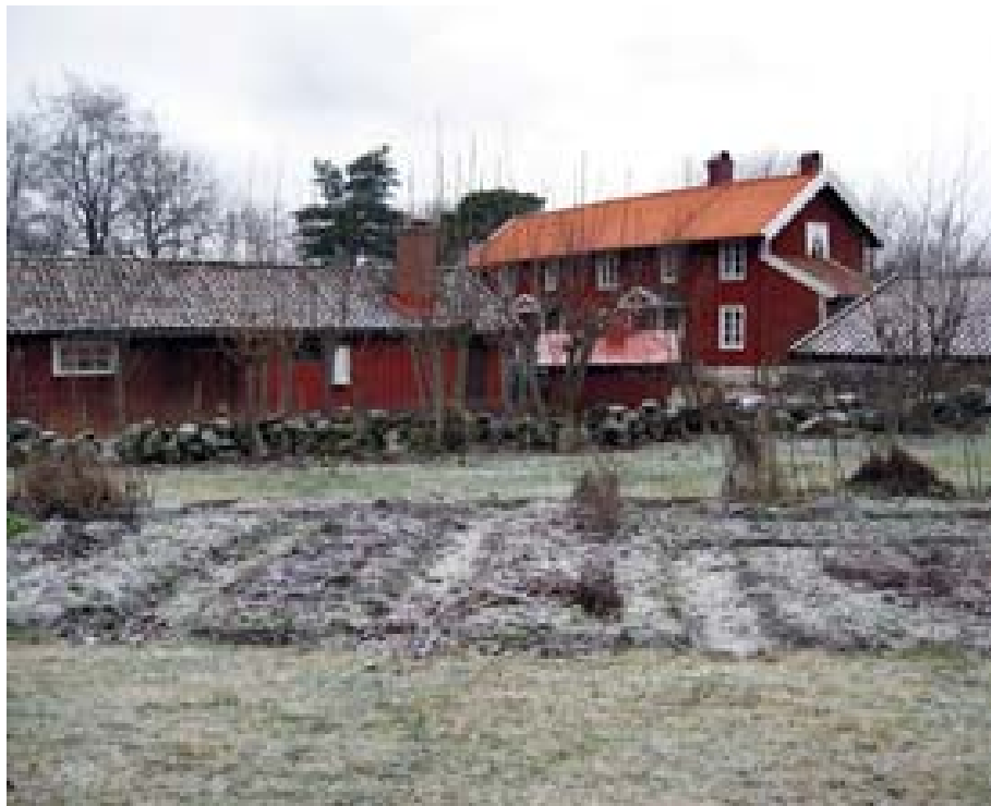
Västergård i Stenunge by

Till de båda mangårdsbyggnaderna hör varsin ladugård. 9 januari brann Västergårds lada ner till grunden. Storleken på ladugårdarna vittnar om att Stenunge by var en rik by med goda tillgångar från åkerbruk och fiske.