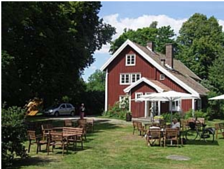
Mariagården i Stenunge by