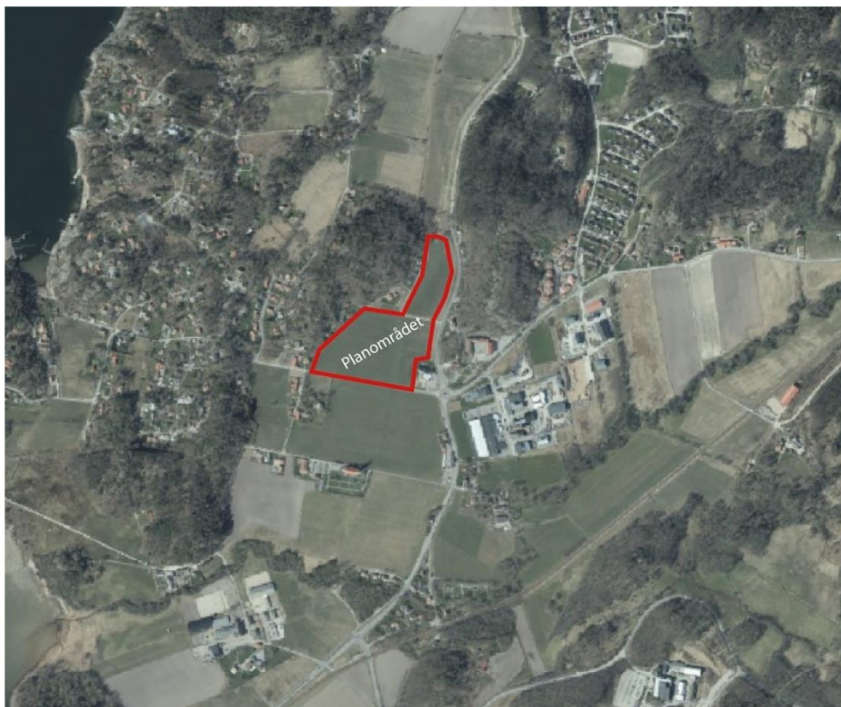
Översiktskarta med planområdets läge markerat.

Bohusbanan, järnvägen mellan Göteborg och Strömstad, sträcker sig cirka 650 meter sydöst om planområdet, E6 sträcker sig ungefär 1,6 kilometer öster om planområdet och färjeöverfarten till Orust ligger ungefär 2,6 kilometer norr om planområdet. Ödsmålsån slingrar sig från nordost till sydväst cirka 600 meter söder om planområdet.